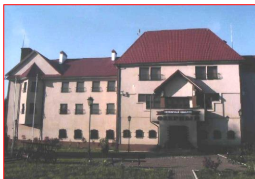
Фото 8. Гостиничный комплекс «Озерный»