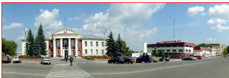
Фото 1. Центральная площадь города Смолевичи