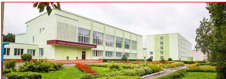
Фото 3. ГУ «Смолевичский государственный аграрно-технический профессиональный лицей»