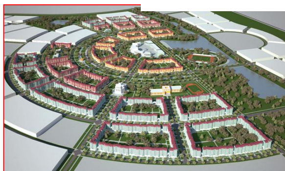
Фото 9. Генеральный план города-спутника Смолевичи