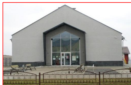
Фото 2. Молодежный центр «СмоРодина»