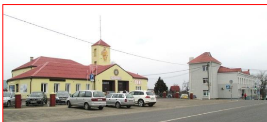
Фото 4. Здание МЧС и почты