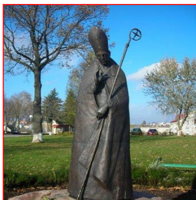
Фото 5. Статуя Святого Валентина