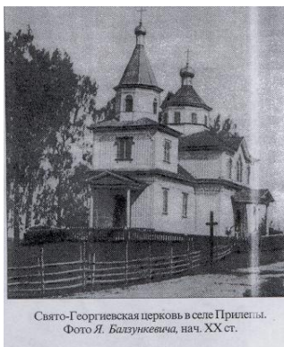
Свято-Георгиевская церковь в селе Прилепы. Фото Я. Балзукевича, нач. XX ст.

4. В 1912 году отцом Иоанном (Пашиным) настоятелем церкви Святого