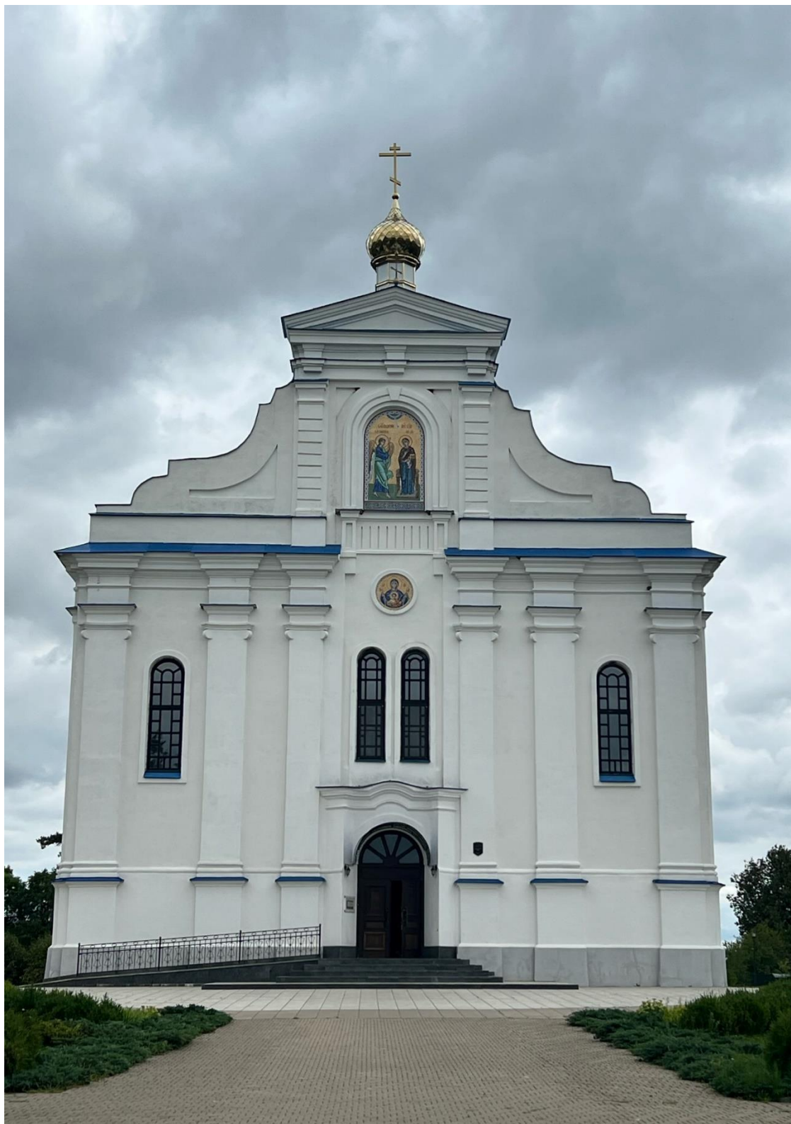
Былы манастыр базыльян: Благовешчанская царква